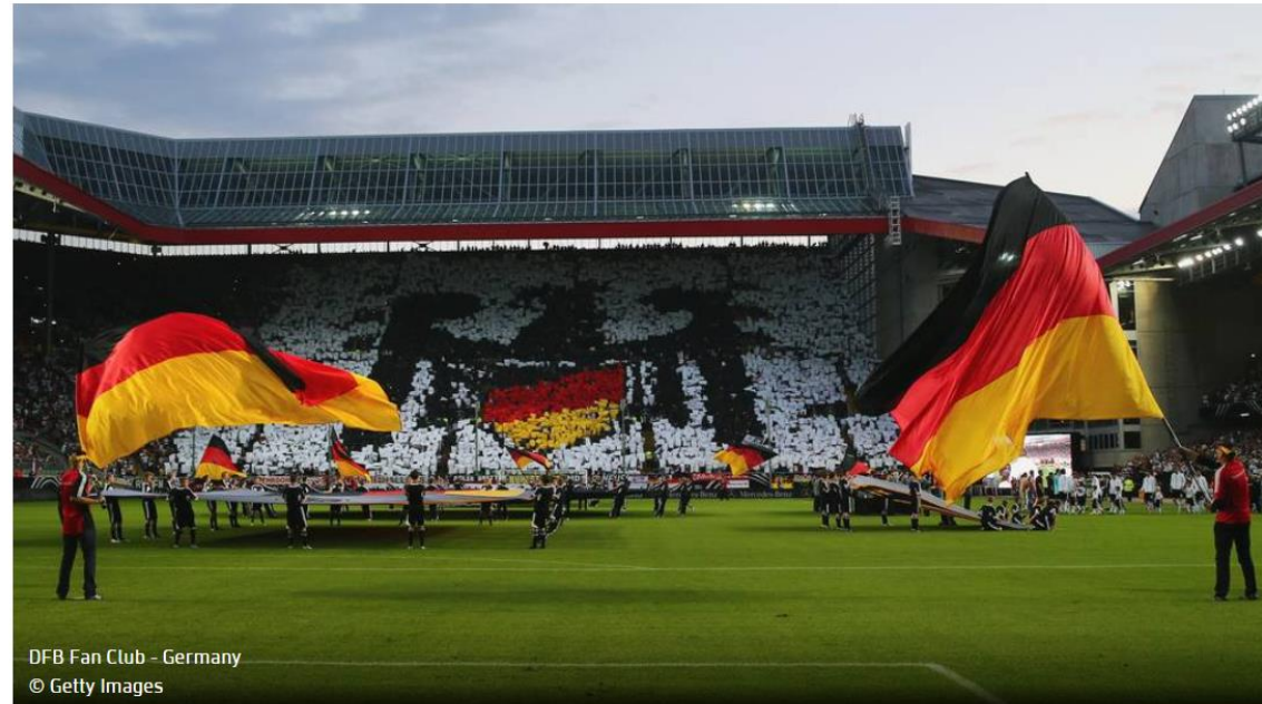
DFB Fan Club - Germany

Sollte Deutschland die EM 2024 ausrichten, wird es keine Spiele im Fritz-Walter-Stadion geben. Die Stadträte sprechen sich für den Rückzug der Bewerbung Kaiserslauterns aus.